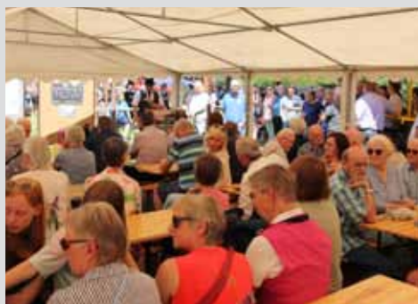
„Diepenau On Fire“ ein voller Erfolg Seite 7