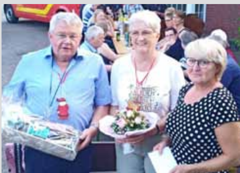
Esserner Modehaus Hadeler schließt Seite 3