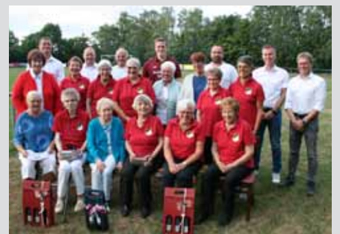
Jahreshauptversammlung SC Viktoria Lavelshoh Seite 10